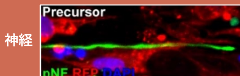
NPJ Regen Med. 2022